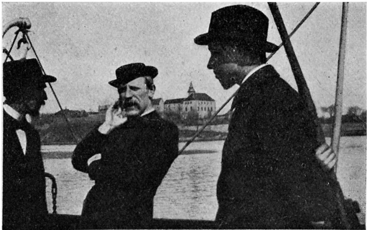
Нансенъ у нас на пароходе.