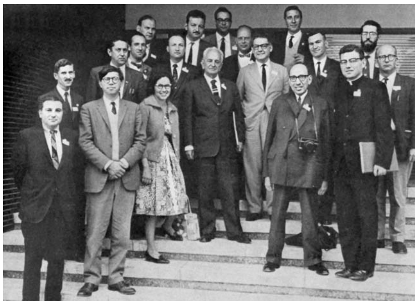
Ф.Г. Добржанский среди коллег на XI Международном генетическом конгрессе в Гааге. Нидерланды, 1963

Возражая современным ему идеологам “биологической” природы человека, Добржанский вновь и вновь противопоставляет религиозное и эволюционное понимание и объяснение человека: «Как оптимистический тезис, что человек по существу добр, так и пессимистический антитезис, что он пал и развращен, предшествовали научной биологии и антропологии. Великие религии, в особенности Христианство, усвоили как тезис, так и антитезис, первый как часть доктрины Первородного Греха, второй — Божественной Милости. Есть ли у науки что-либо, что можно было бы добавить к этим древним человеческим проникновениям? По крайней мере, она может поместить их в контекст некоторых хорошо обоснованных открытий, которые предполагают, что человек не предопределен своей