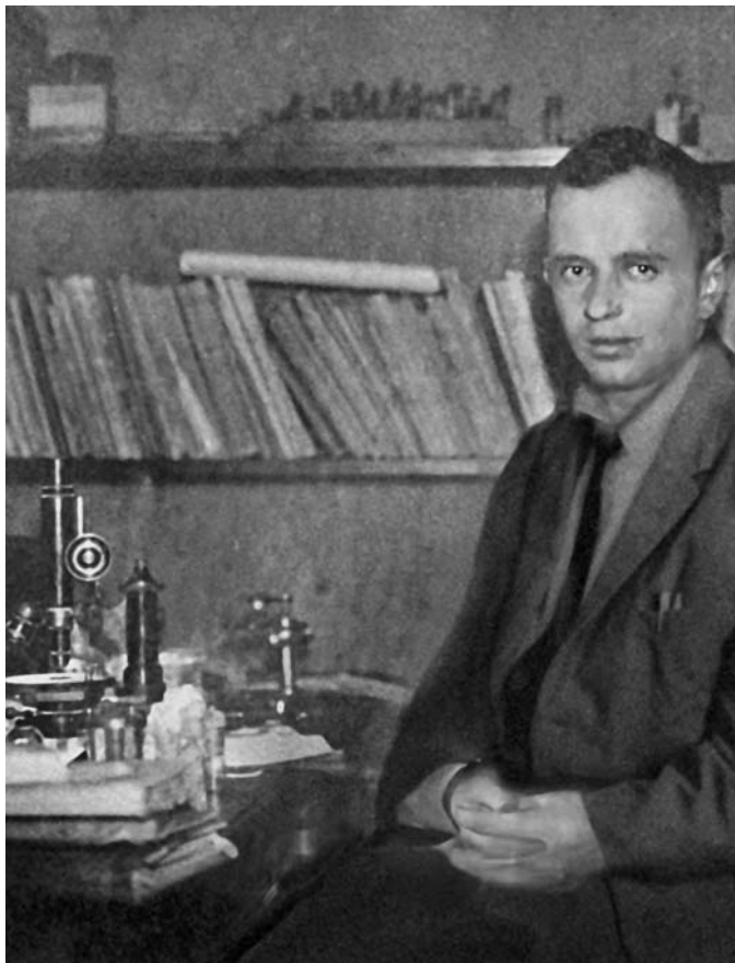
Ф.Г. Добржанский в лаборатории. Ленинград. 1925

Но почему именно противоречие, почему не какое-нибудь более “дружественное”, более гармоничное взаимодействие? Такой вопрос можно было бы задать, если встать на точку зрения тех, кто убежден или делает вид, что убежден, в совместности науки и религии, в их своего рода “взаимодополняемости”. Именно так считал Добржанский с самого начала и до конца своей жизни, которая в каком-то смысле и была посвя-