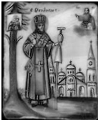
Одна из икон Святого Феодосия