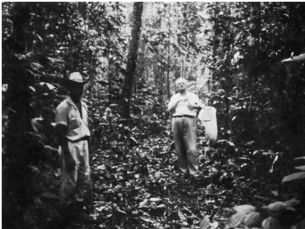
Ф.Г. Добржанский в джунглях. 1968

tozum. Их надо довести до какого-то логически приемлемого конца. Плохо, но может быть гораздо хуже! И при всем том жить до безобразия хочется” 58 .