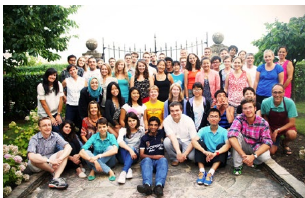
«Летние студенты» университетов UNIL и EPFL (и их руководители и организаторы) на барбекю